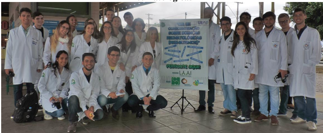
IMAGEM 1 – Participantes da LAAI durante o “Dia de Conscientização sobre Doenças Reumatológicas”