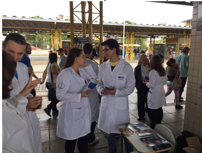
IMAGEM 2 – “Dia de Conscientização sobre Doenças Reumatológicas”

Legenda: Na foto, podem ser observados ligantes interagindo entre si e com a população. Sobre a mesa, alguns dos pôlderes entregues aos transeuntes.